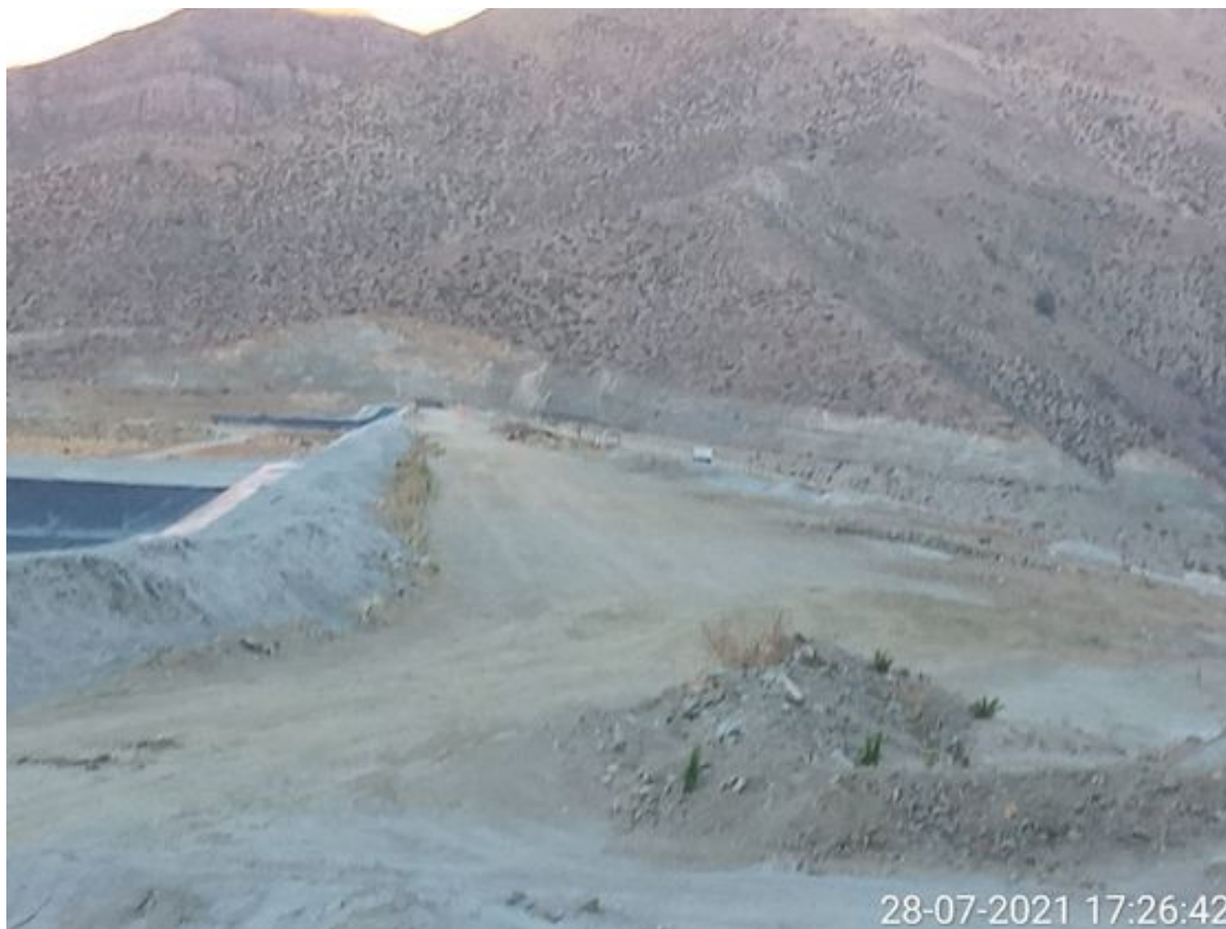
Foto 42: Medida: Aplicación Soiltiac coronamiento del muro. Lugar: Tranque Quillayes. Comentarios: no se observan trabajos en el área