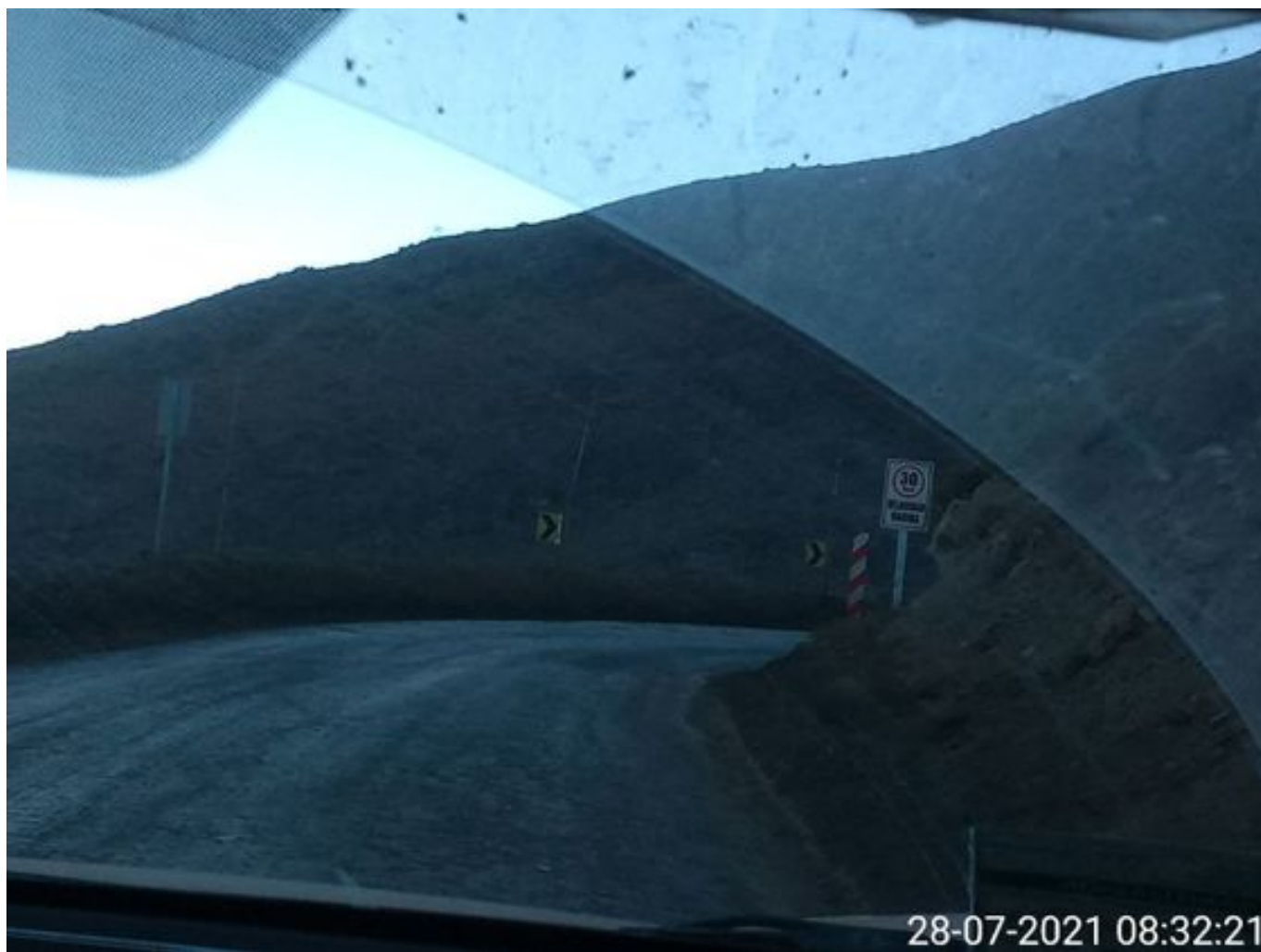
Foto 31: Medida: Aplicación Dust Control. Lugar: Quillay a Hotel Mina. Comentarios: camino con aplicación de producto operativo