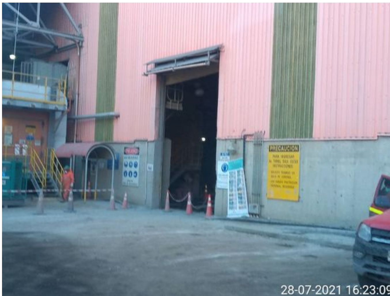
Foto 22: Medida: Regaderas. Lugar: TP2. Comentarios: correas detenidas por falta de mineral en proceso en stock pile de chancado