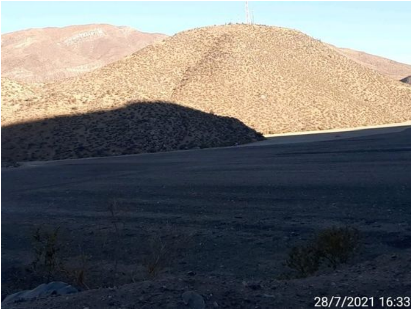
Foto 44: Medida: Aplicación de εμπρεστίτο. Lugar: Sector Cola. Comentarios: no se observan trabajos en el área