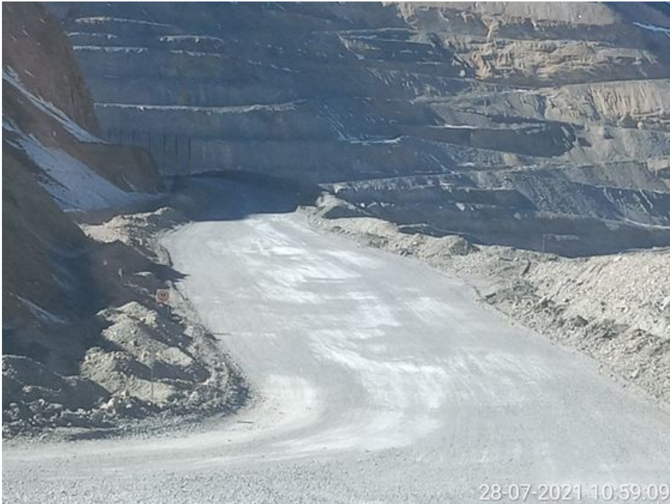
Foto 5: Medida: Riego de caminos. Lugar: Fases superiores. Comentarios: rampas se encuentran sin humectacion empresa besalco no trabaja en turno noche ni en turno dia, fuentes de emisión tránsito de caex , tránsito de equipos menores , laderas y pretilles por fuertes ráfagas de viento levantando bastante material particulado