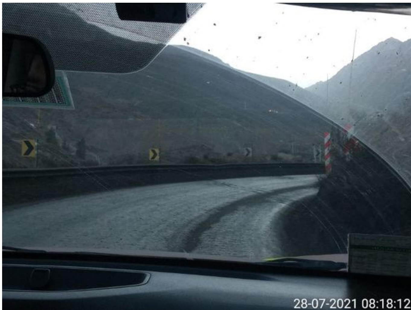
Foto 32: Medida: Aplicación Dust Control. Lugar: Chacay a Quillay. Comentarios: Camino con aplicación de producto operativo