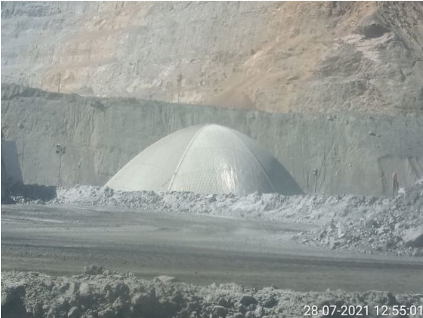
Foto 25: Medida: Espumante en Correas y Stock Pile. Lugar: Chancado 2. Comentarios: producto operativo no se observa material particulado fuera del domo