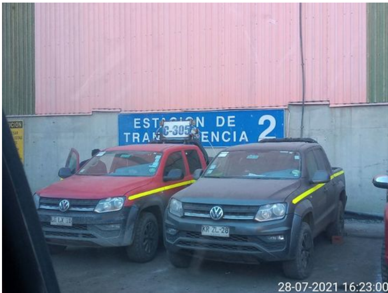
Foto 23: Medida: Regaderas. Lugar: TP2. Comentarios: correas detenidas por falta de mineral en proceso en stock pile de chancado