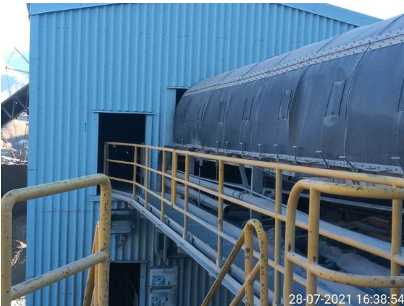
Foto 45: Medida: Regaderas. Lugar: Descarga stock pile planta. Comentarios: correas detenidas por falta de mineral en proceso en stock pile de chancado