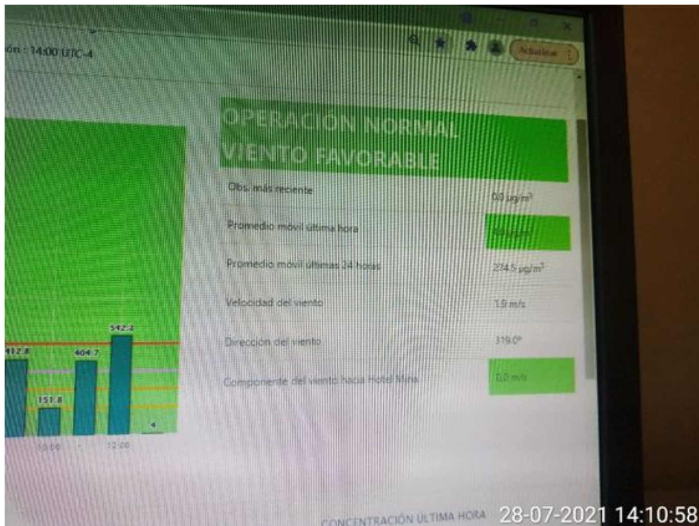
Foto 52: Medida: Paralización de equipos de carguío. Lugar: Medida Adicional. Comentarios: se presenta alerta 4 no pronosticada equipos detenidos correspondiente , empresa besalco no trabaja durante turno noche y turno día, queda operación normal a las 13:23 hrs con promedio móvil y con promedio hora operación normal de 13 a 14 hrs , en la fotografía se ve en detalles las detenciones de equipos