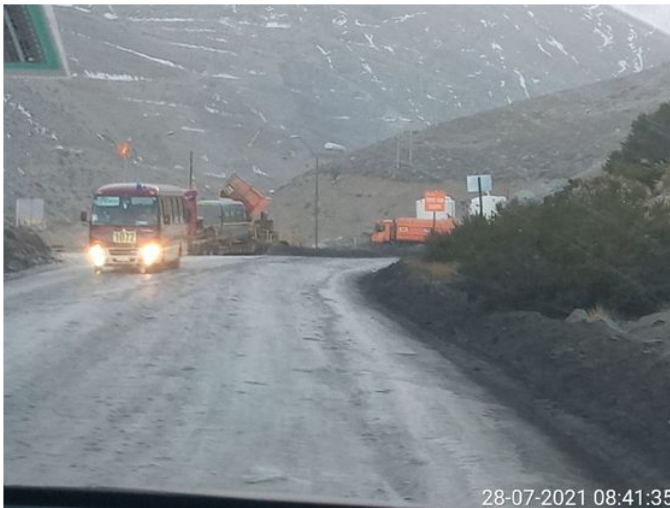
Foto 28: Medida: Aplicación de producto Corp. Vial. Lugar: Hotel Mina a Garita Mina. Comentarios: aplicación temprana no se realiza por bajas temperaturas, pero no se observa material particulado en el circuito