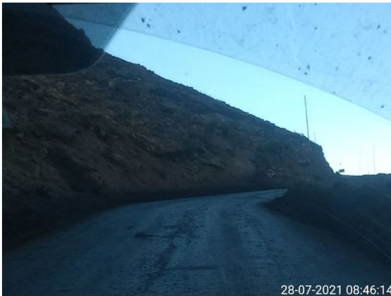
Foto 29: Medida: Aplicación de producto Corp. Vial. Lugar: Hotel Mina a Garita Mina. Comentarios: aplicación temprana no se realiza por bajas temperaturas, pero no se observa material particulado en el circuito