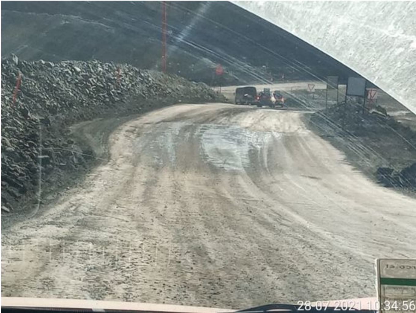
Foto 11: Medida: Aplicación anticongelante. Lugar: Caminos Interior Mina. Comentarios: anticongelante operativo