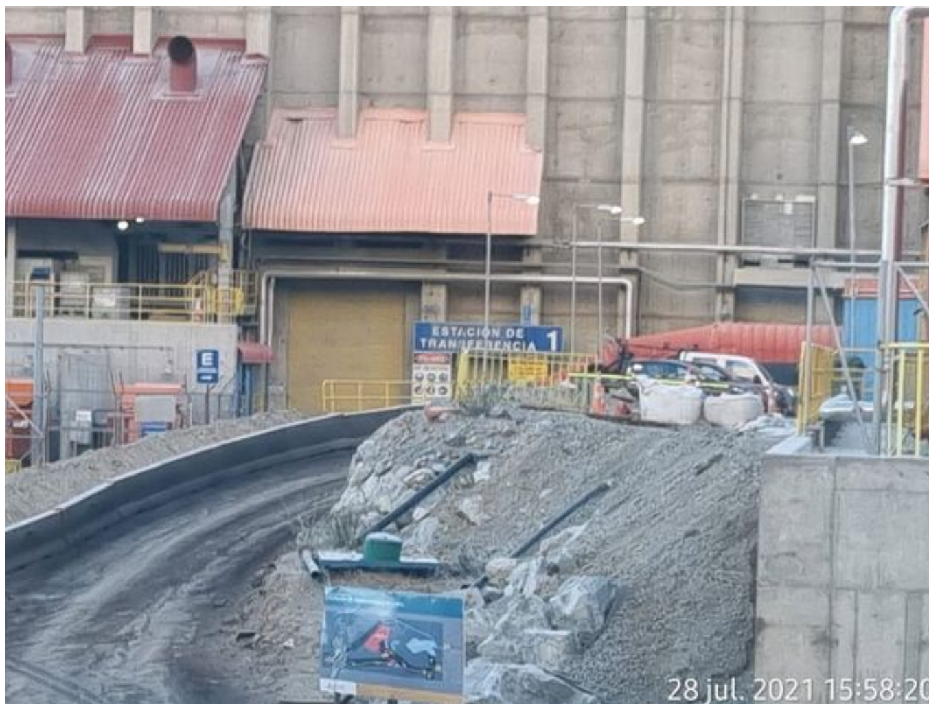
Foto 24: Medida: Regaderas. Lugar: TP1. Comentarios: correas detenidas por falta de mineral en proceso en stock pile de chancado