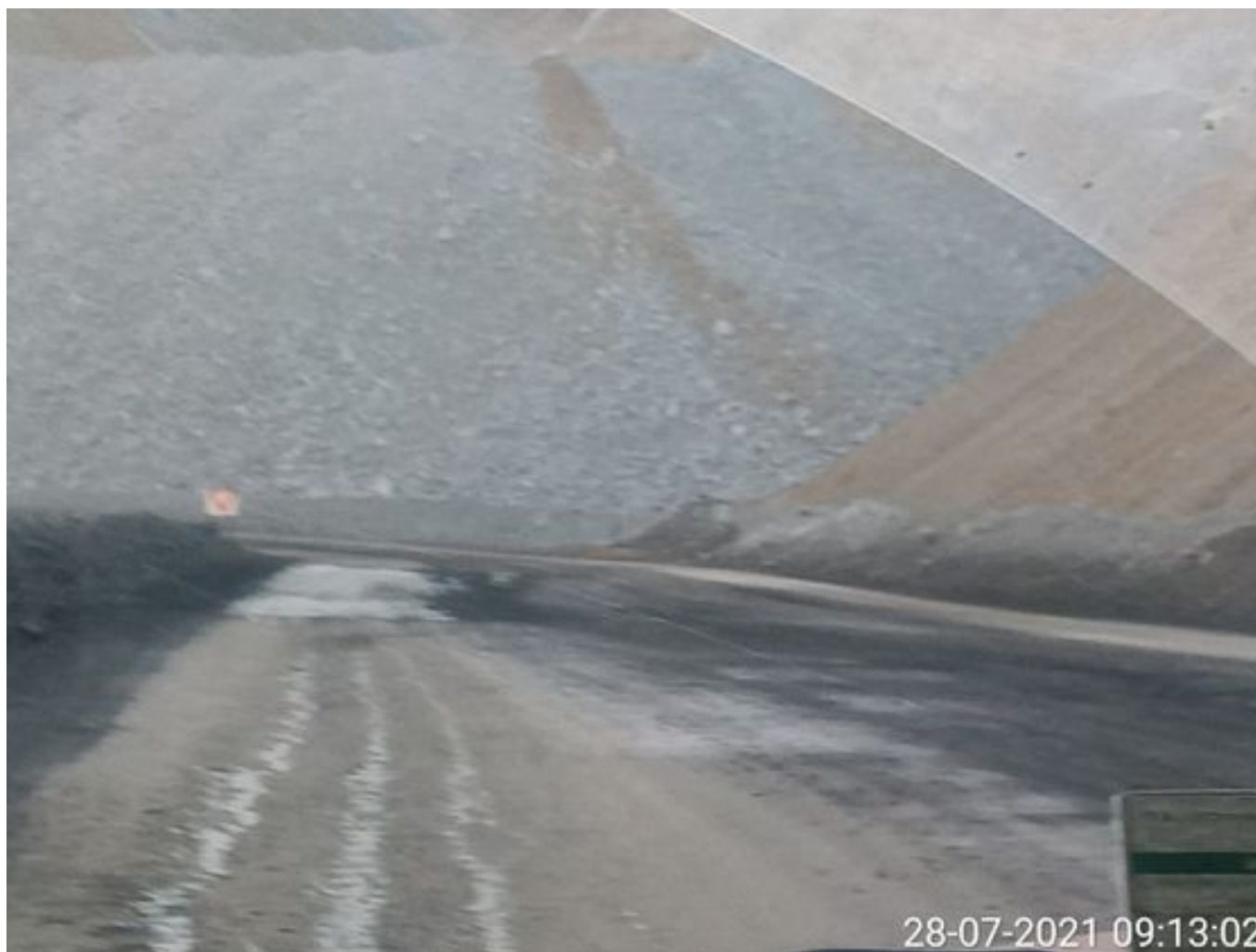
Foto 3: Medida: Riego de caminos. Lugar: Fases Inferiores. Comentarios: rampas con aplicación de producto operativo entre cortado con 3 camiones Das en pistas , el backup se encuentra con fuga de aire en el acumulador de aire, botaderos detenidos por alerta mp10