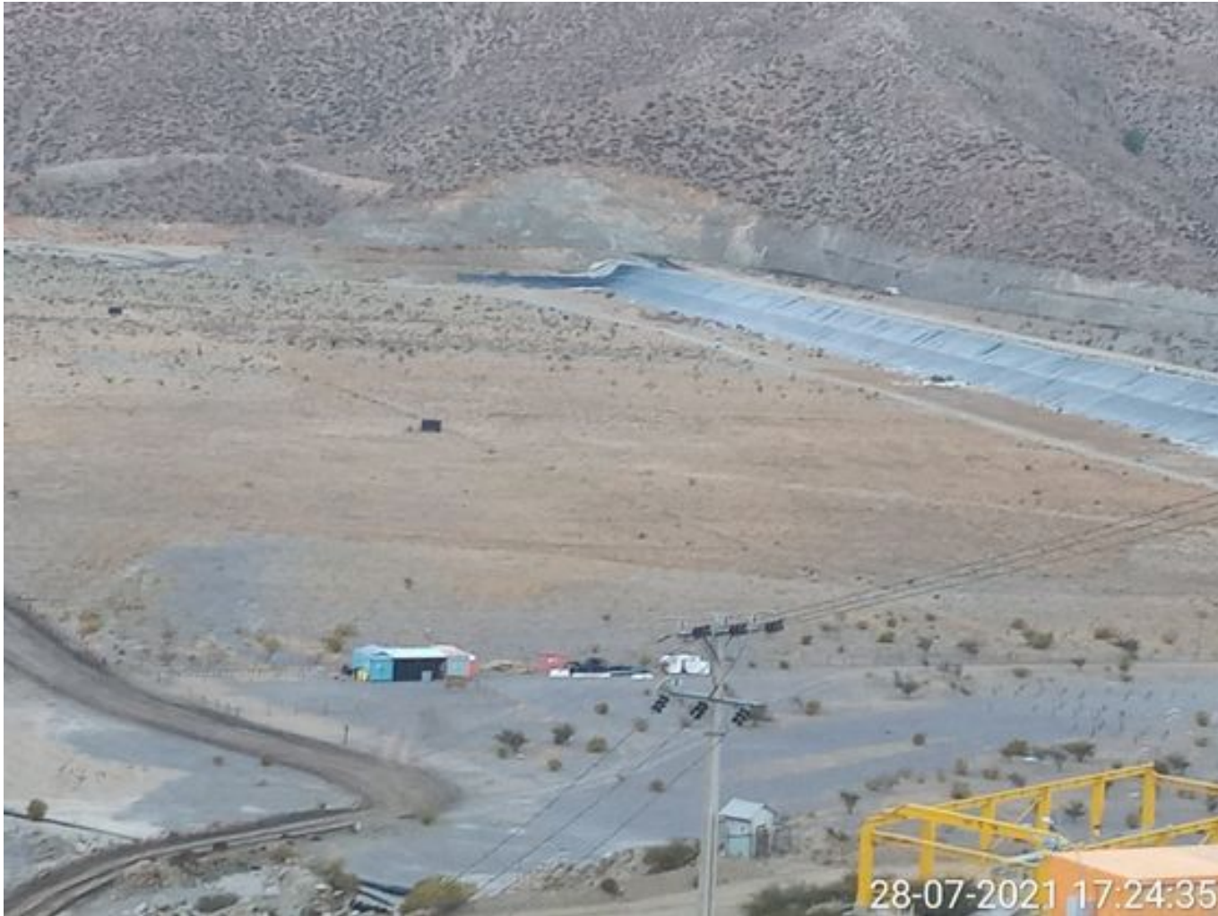
Foto 40: Medida: Aplicación de empréstito. Lugar: Sector Tranque. Comentarios: no se observan trabajos en el área