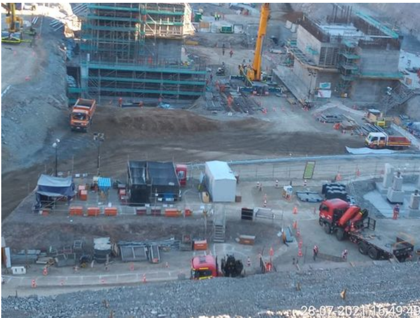
Foto 50: Medida: Riego de caminos en frentes de trabajo. Lugar: INCO. Comentarios: riego de caminos operativo con 1 camion de bechtel