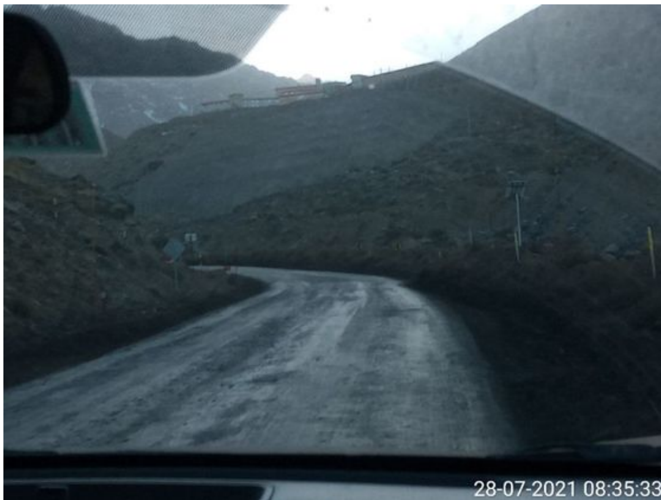
Foto 30: Medida: Aplicación Dust Control. Lugar: Quillay a Hotel Mina. Comentarios: camino con aplicación de producto operativo