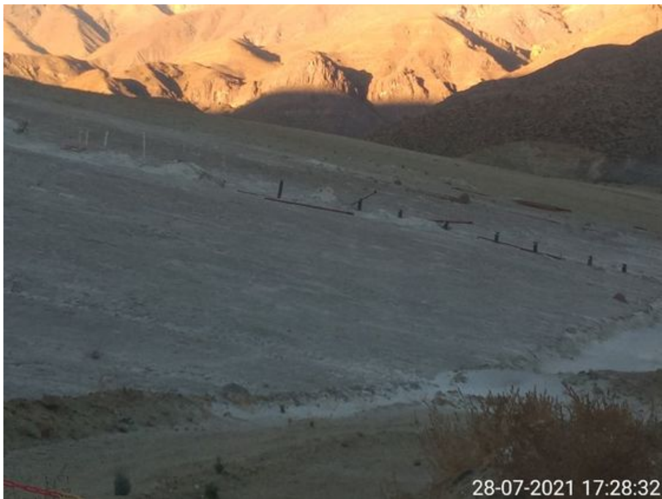
Foto 37: Medida: Aplicación de supresor. Lugar: Sector Muro. Comentarios: no se observan trabajos en el área