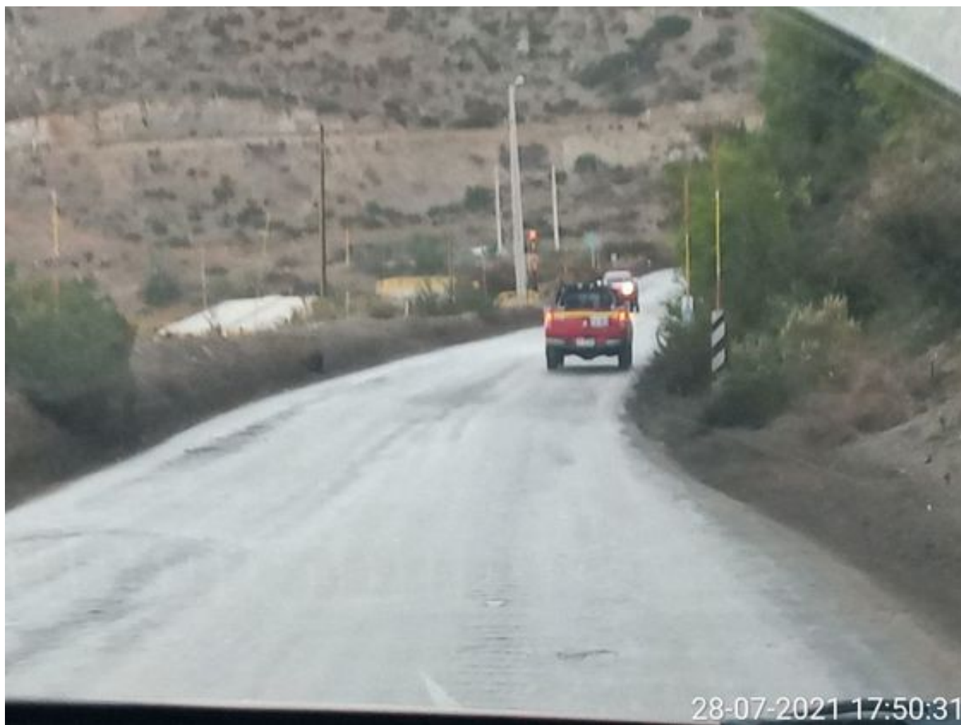
Foto 35: Medida: Aplicación Dust Control. Lugar: Portones a Chacay. Comentarios: camino con aplicación de producto operativo