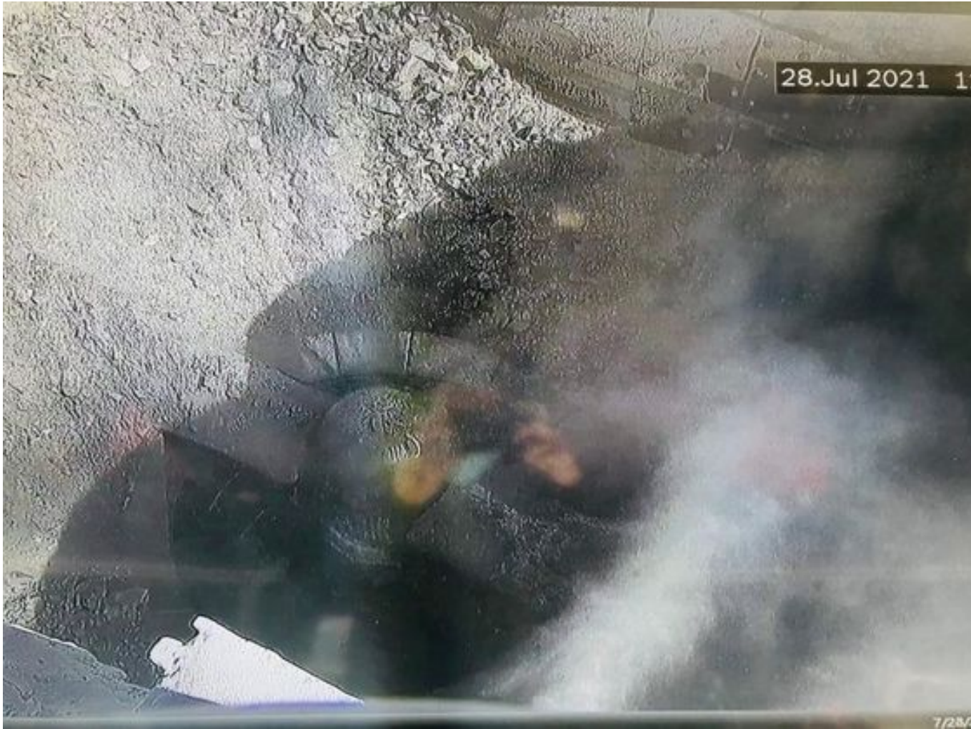
Foto 21: Medida: Supresor de polvo. Lugar: Taza Chancado 1. Comentarios: supresores se observan operativos pero medida no es suficiente para mitigar material particulado en descarga de caex en taza