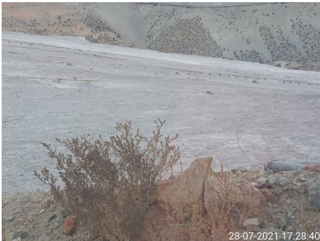
Foto 38: Medida: Aplicación de supresor. Lugar: Sector Muro. Comentarios: no se observan trabajos en el área