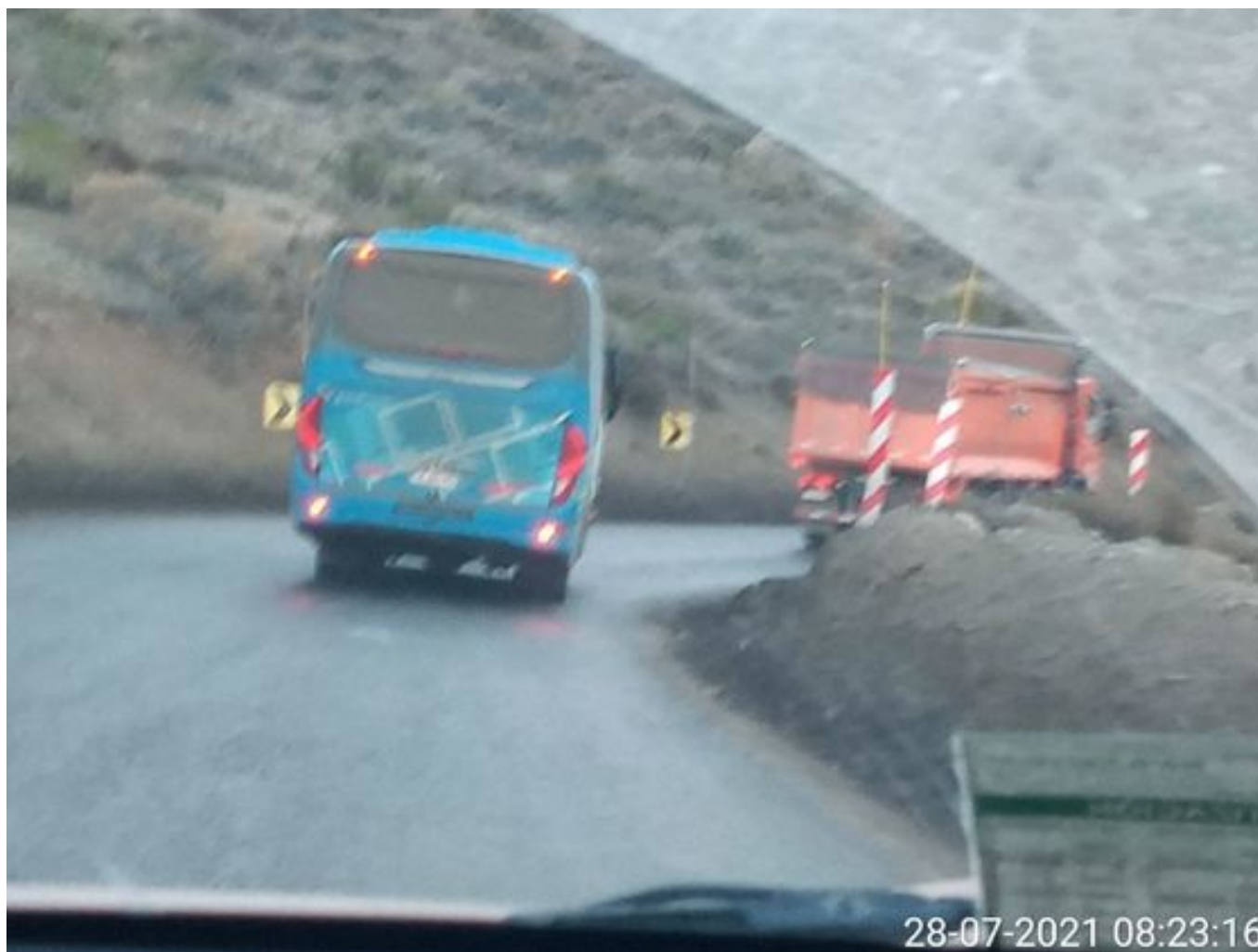
Foto 33: Medida: Aplicación Dust Control. Lugar: Chacay a Quillay. Comentarios: Camino con aplicación de producto operativo