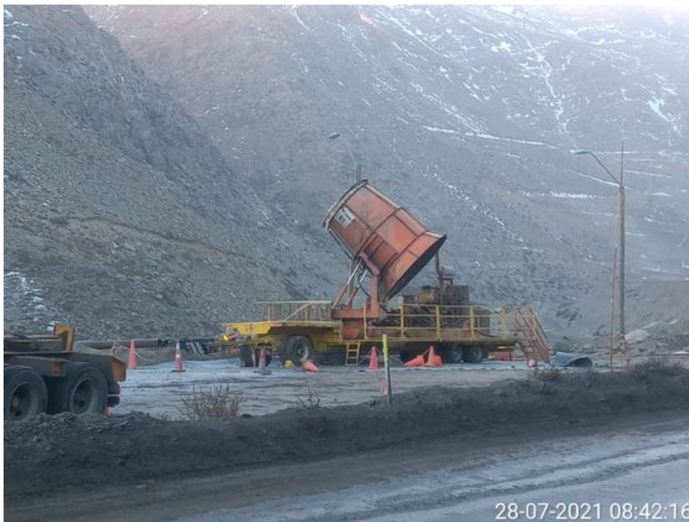
Foto 8: Medida: Fogcannon 1. Lugar: . Comentarios: equipo detenido por procedimiento y fuera por falta de combustible