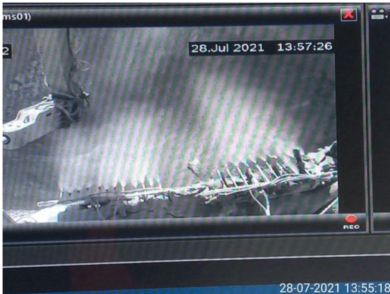
Foto 19: Medida: Supresor de polvo. Lugar: Taza Chancado 2. Comentarios: supresores se observan operativos pero medida no es suficiente para mitigar material particulado en descarga de caex en taza de chancado