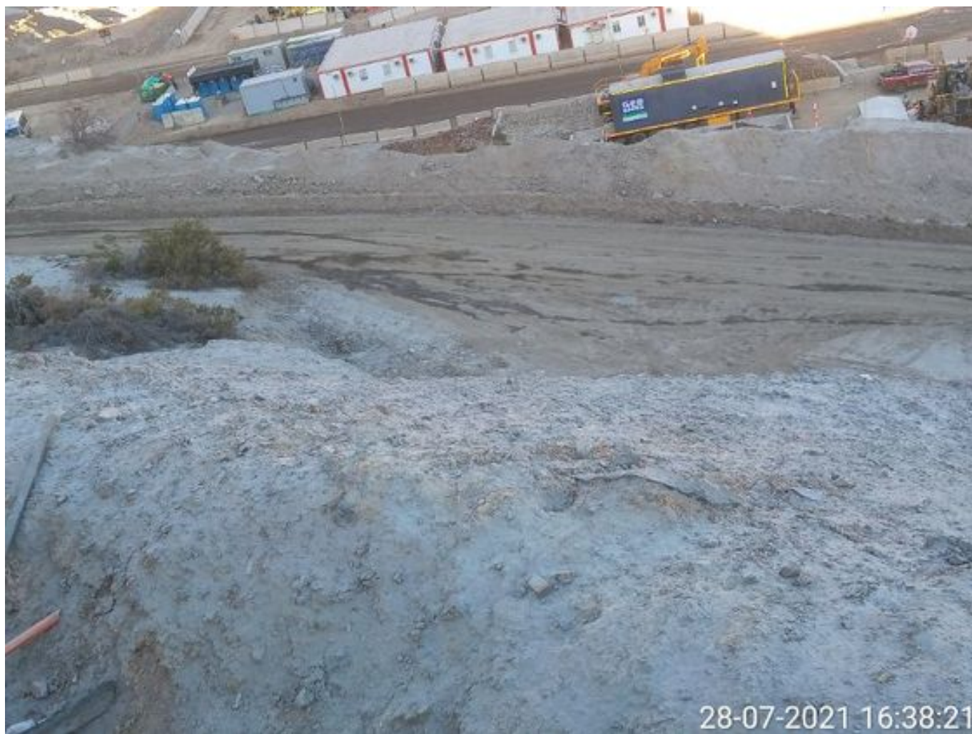
Foto 48: Medida: Riego Caminos. Lugar: Stock pile planta. Comentarios: camino con riego operativo