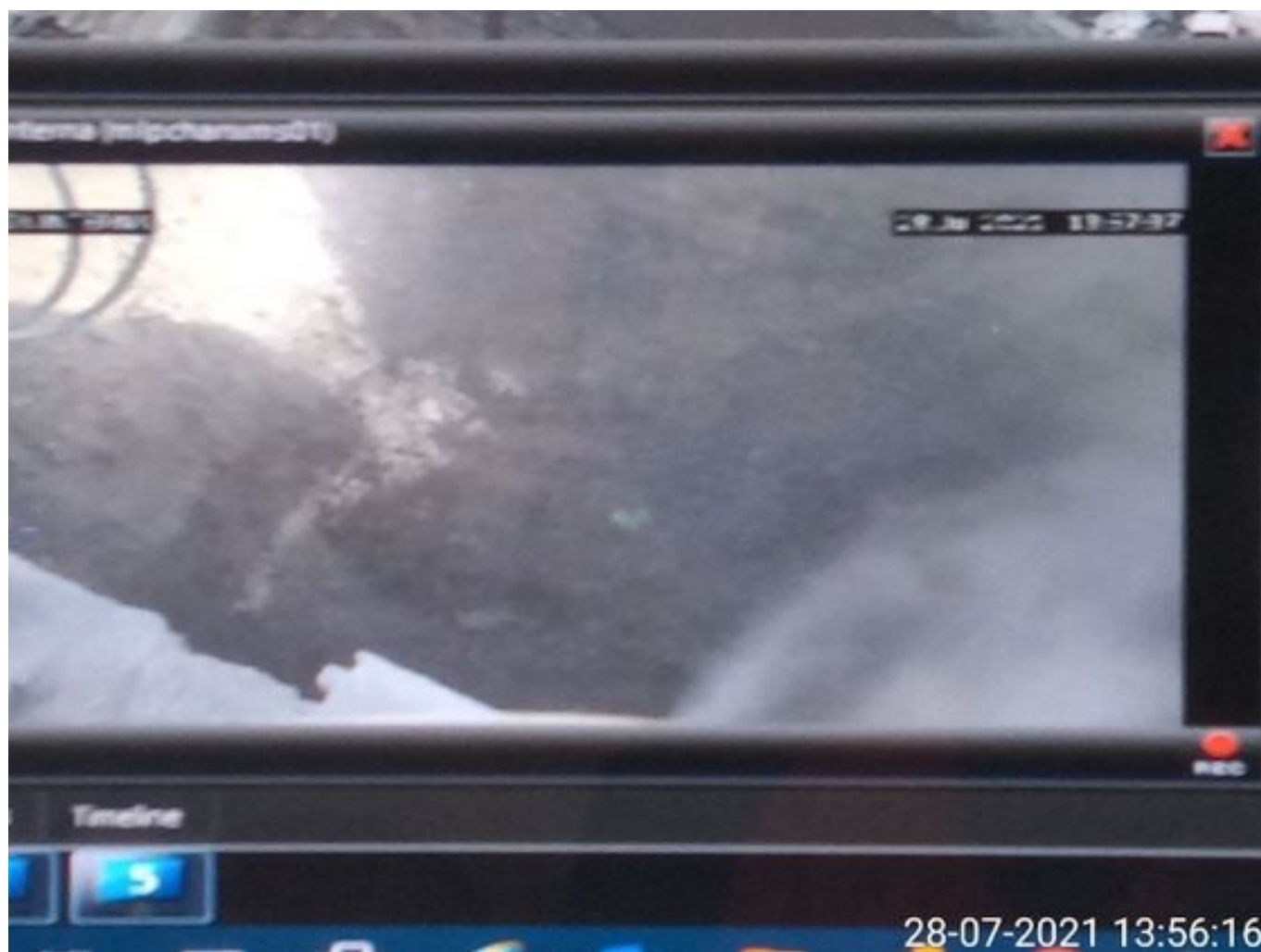
Foto 20: Medida: Supresor de polvo. Lugar: Taza Chancado 1. Comentarios: supresores se observan operativos pero medida no es suficiente para mitigar material particulado en descarga de caex en taza