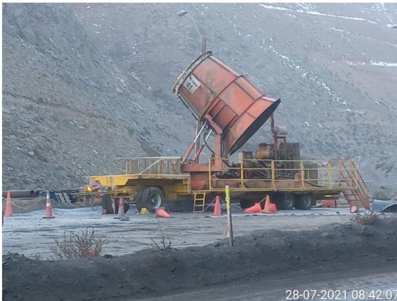
Foto 7: Medida: Fogcannon 1. Lugar: . Comentarios: equipo detenido por procedimiento y fuera por falta de combustible