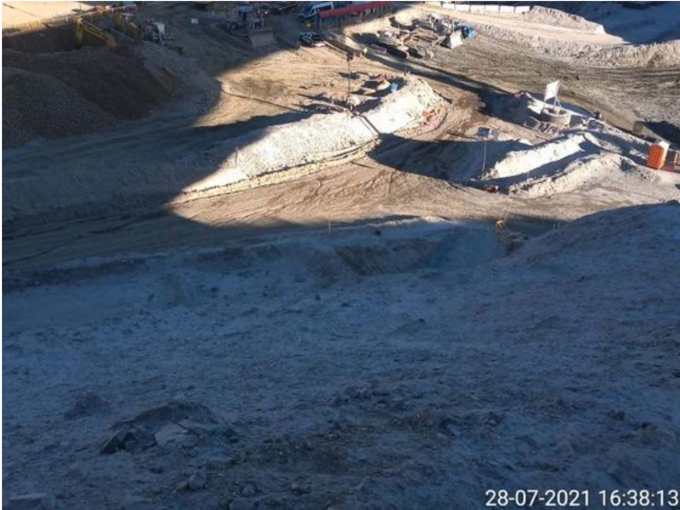
Foto 47: Medida: Riego Caminos. Lugar: Stock pile planta. Comentarios: camino con riego operativo