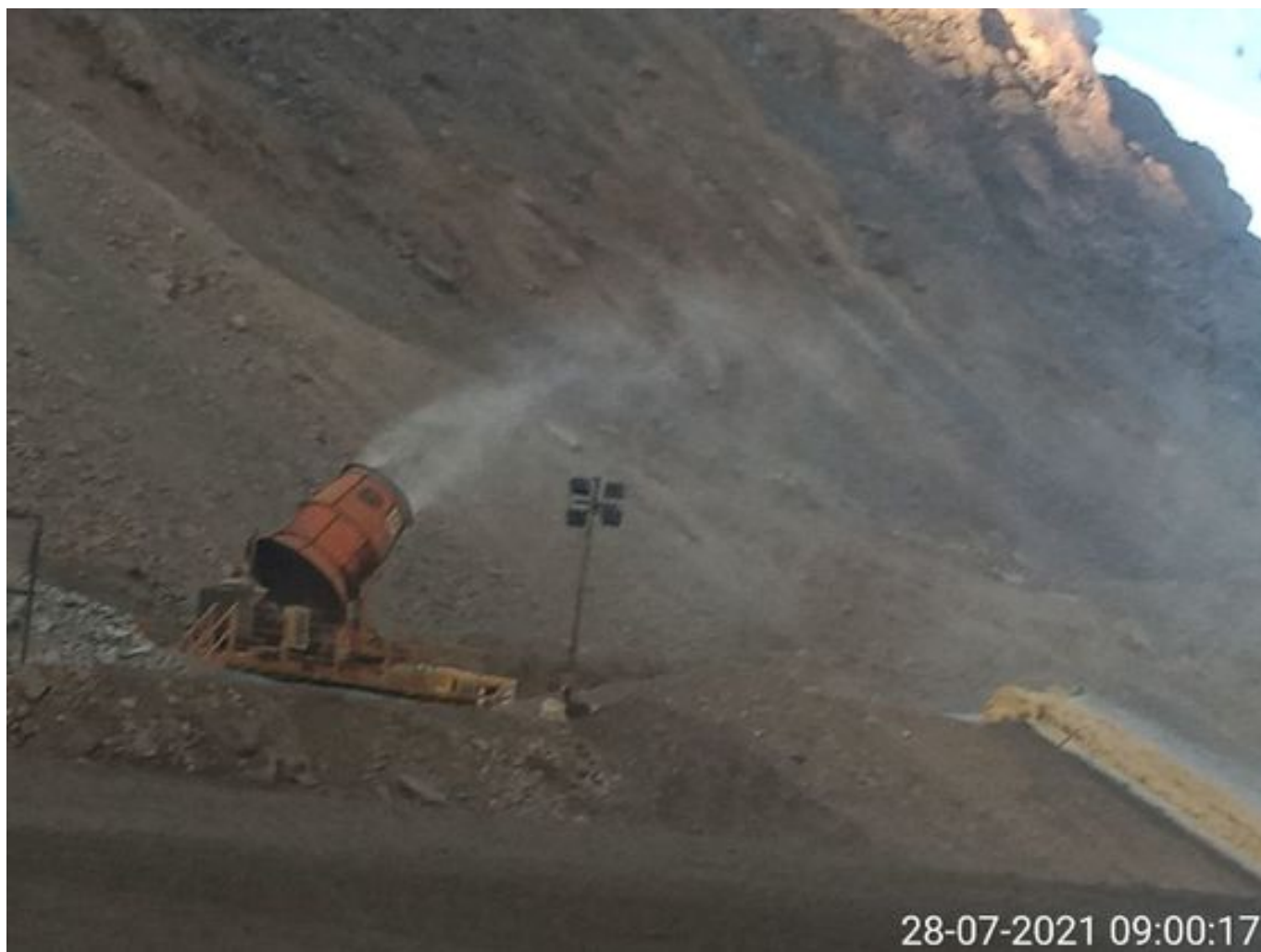
Foto 13: Medida: Fogcannon 2. Lugar: . Comentarios: equipo operativo desde las 02:15 hrs de anoche