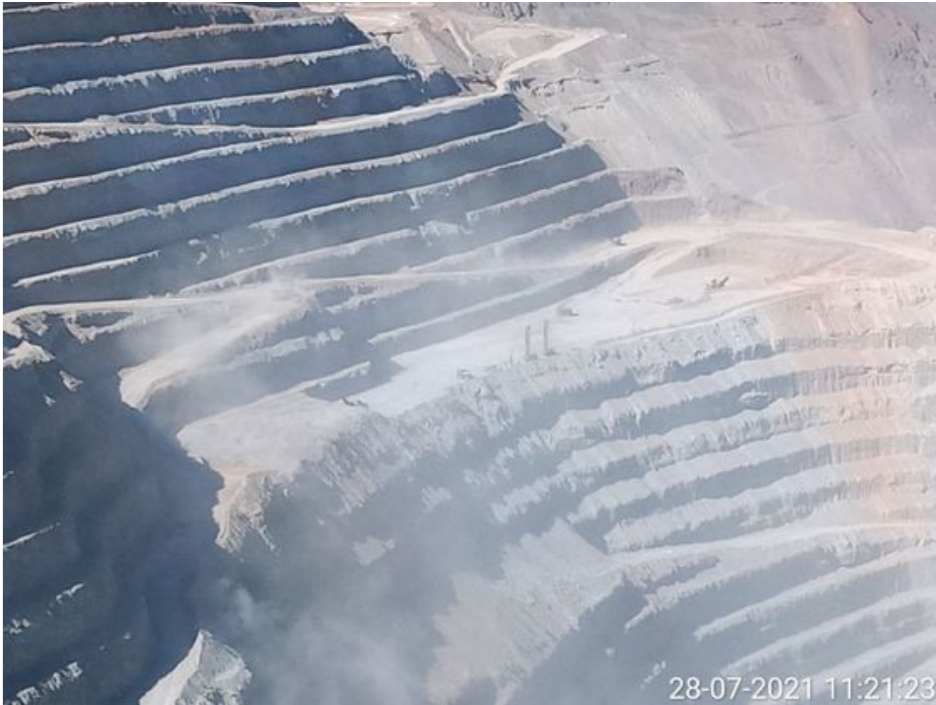
Foto 6: Medida: Riego de caminos. Lugar: Fases superiores. Comentarios: rampas se encuentran sin humectacion empresa besalco no trabaja en turno noche ni en turno dia, fuentes de emisión tránsito de caex , tránsito de equipos menores , laderas y pretilos por fuertes ráfagas de viento levantando bastante material particulado