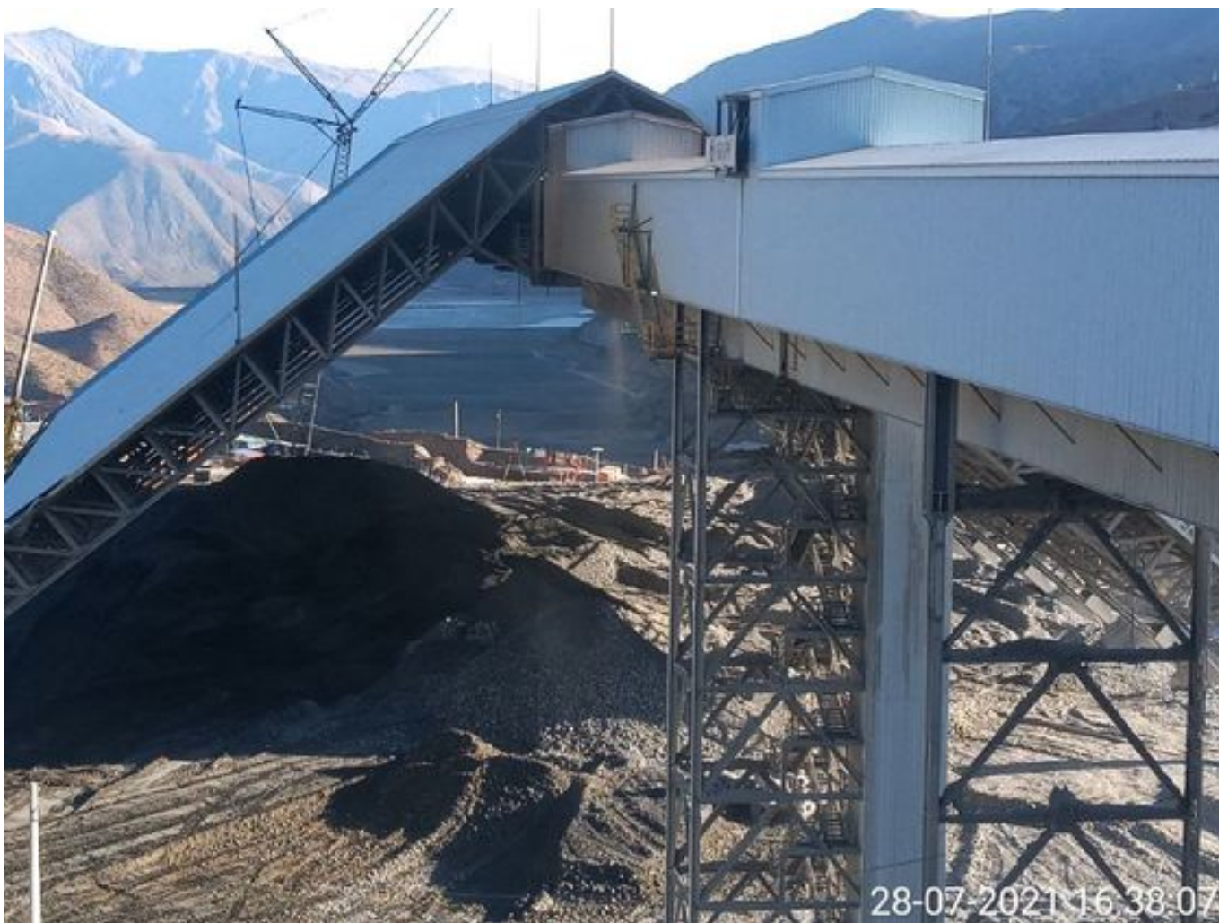
Foto 46: Medida: Regaderas. Lugar: Descarga stock pile planta. Comentarios: correas detenidas por falta de mineral en proceso en stock pile de chancado