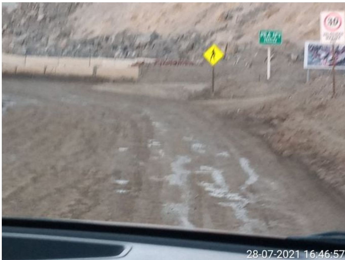
Foto 49: Medida: Riego de caminos en frentes de trabajo. Lugar: INCO. Comentarios: riego de caminos operativo con 1 camion de bechtel