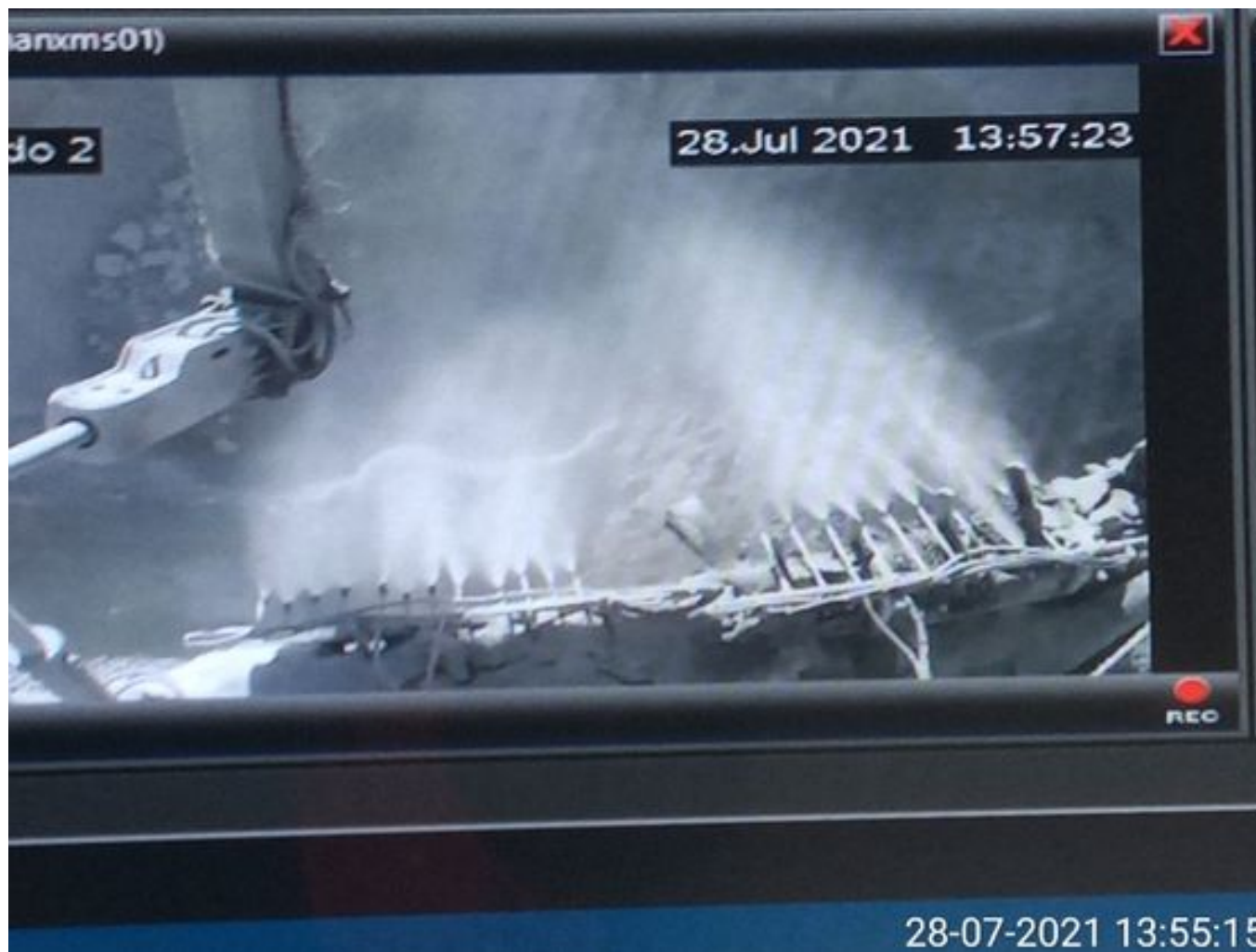
Foto 18: Medida: Supresor de polvo. Lugar: Taza Chancado 2. Comentarios: supresores se observan operativos pero medida no es suficiente para mitigar material particulado en descarga de caex en taza de chancado