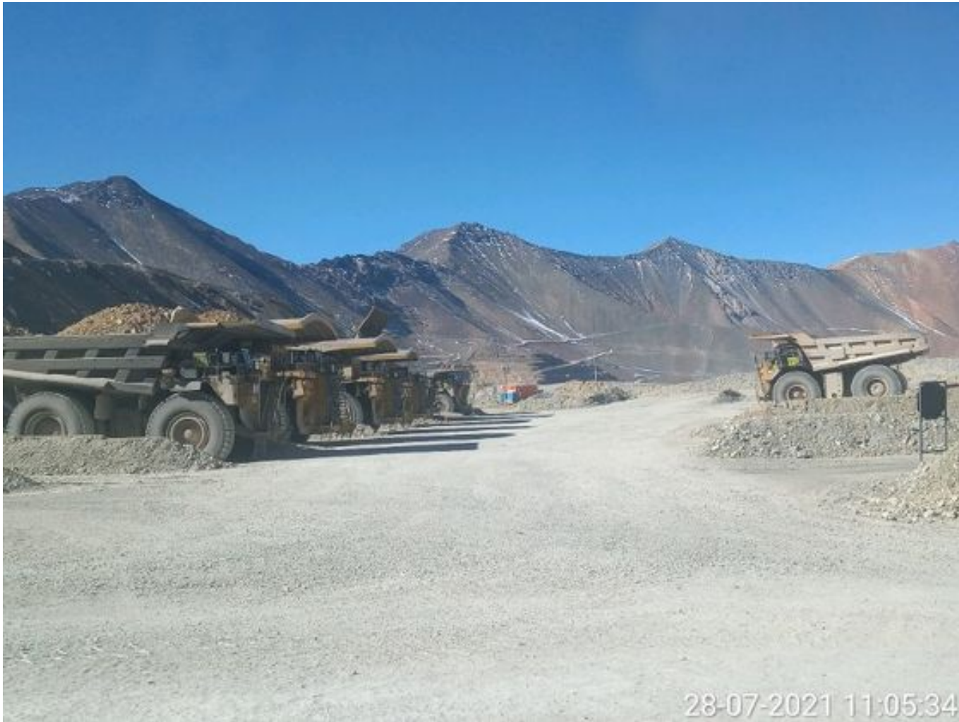
Foto 9: Medida: Riego de caminos EPSA Cerro Amarillo. Lugar: Fases superiores. Comentarios: rampas se encuentran sin humectacion , equipos de carguío se encuentran detenidos por alerta mp10, pero al transitar vehículos livianos se observa material particulado