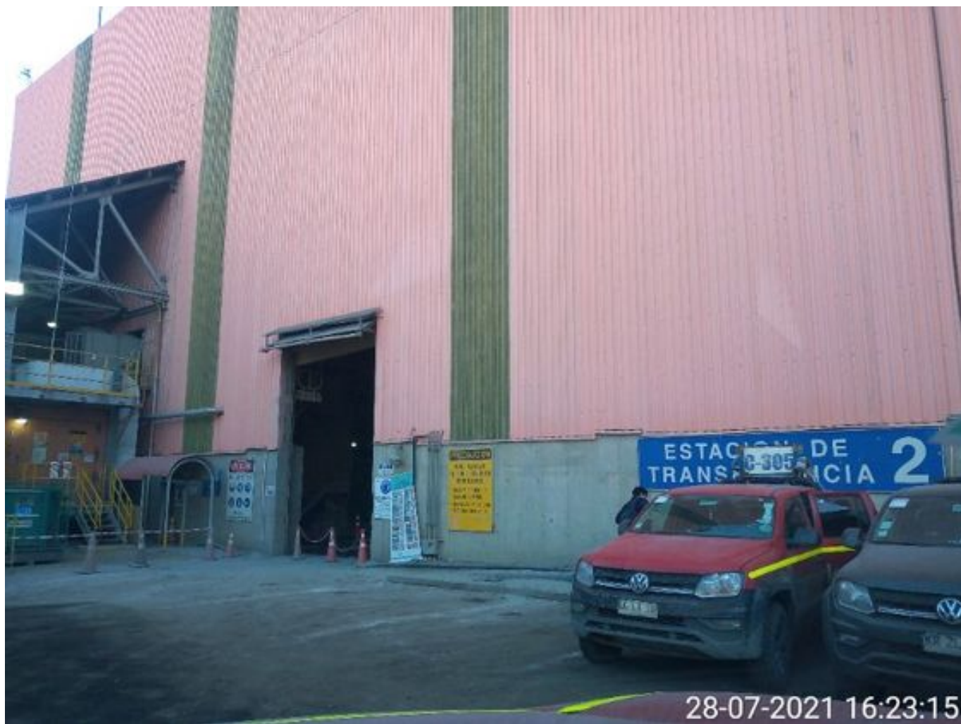
Foto 15: Medida: Aplicación Espuma Surfactante. Lugar: Correa CV 007. Comentarios: correas detenidas por falta de mineral en proceso en stock pile de chancado