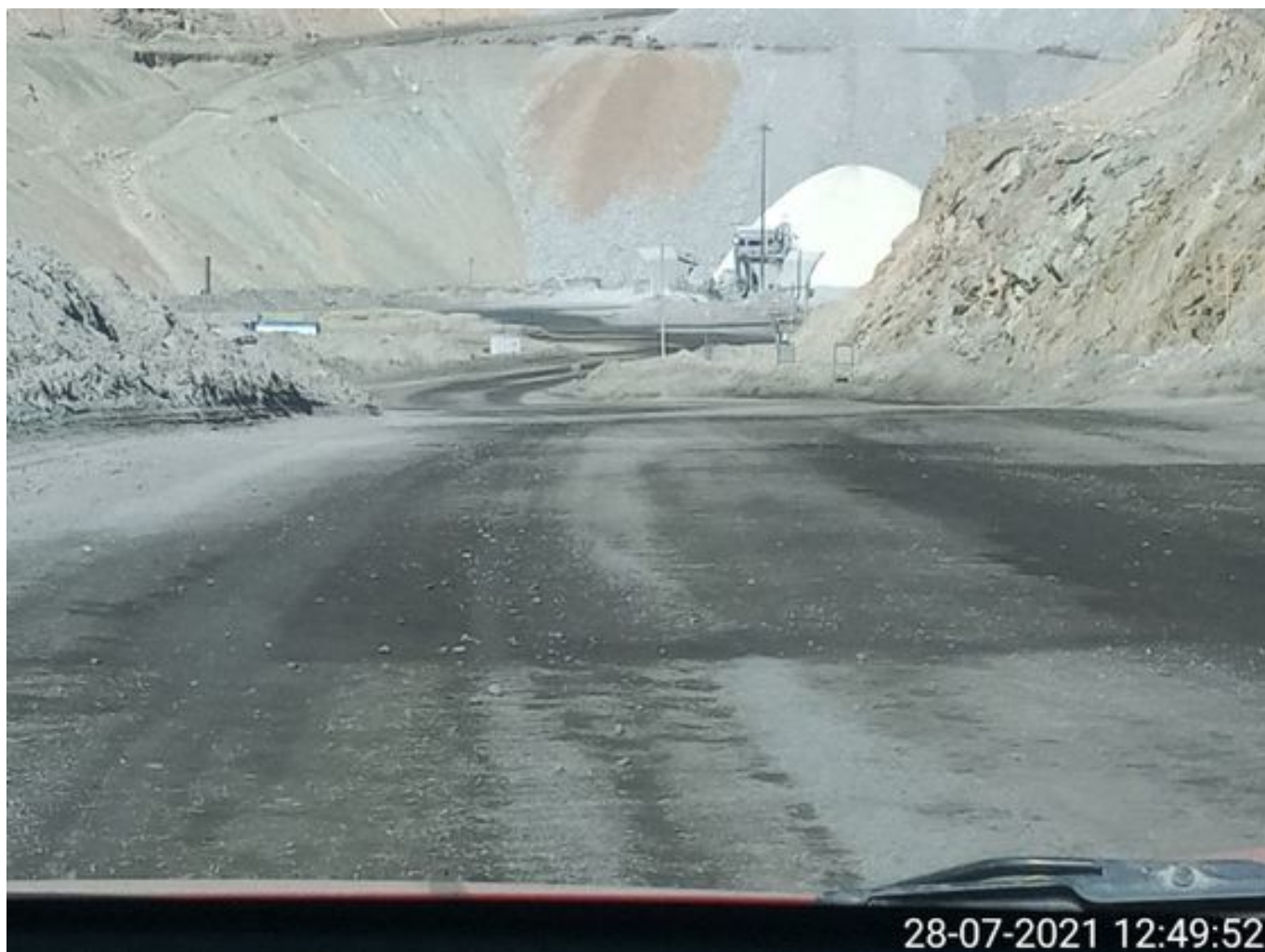
Foto 2: Medida: Riego de caminos. Lugar: Fases Intermedias. Comentarios: rampas con aplicación de producto operativo entre cortado con apoyo de camiones DAS, empresa besalco tanto como camiones aljibes y equipos de apoyo no trabajan en turno noche ni en turno día, fuentes de emisión tránsito de Caex , descarga de caex en taza de chancado y laderas y pretilas por fuertes ráfagas de viento