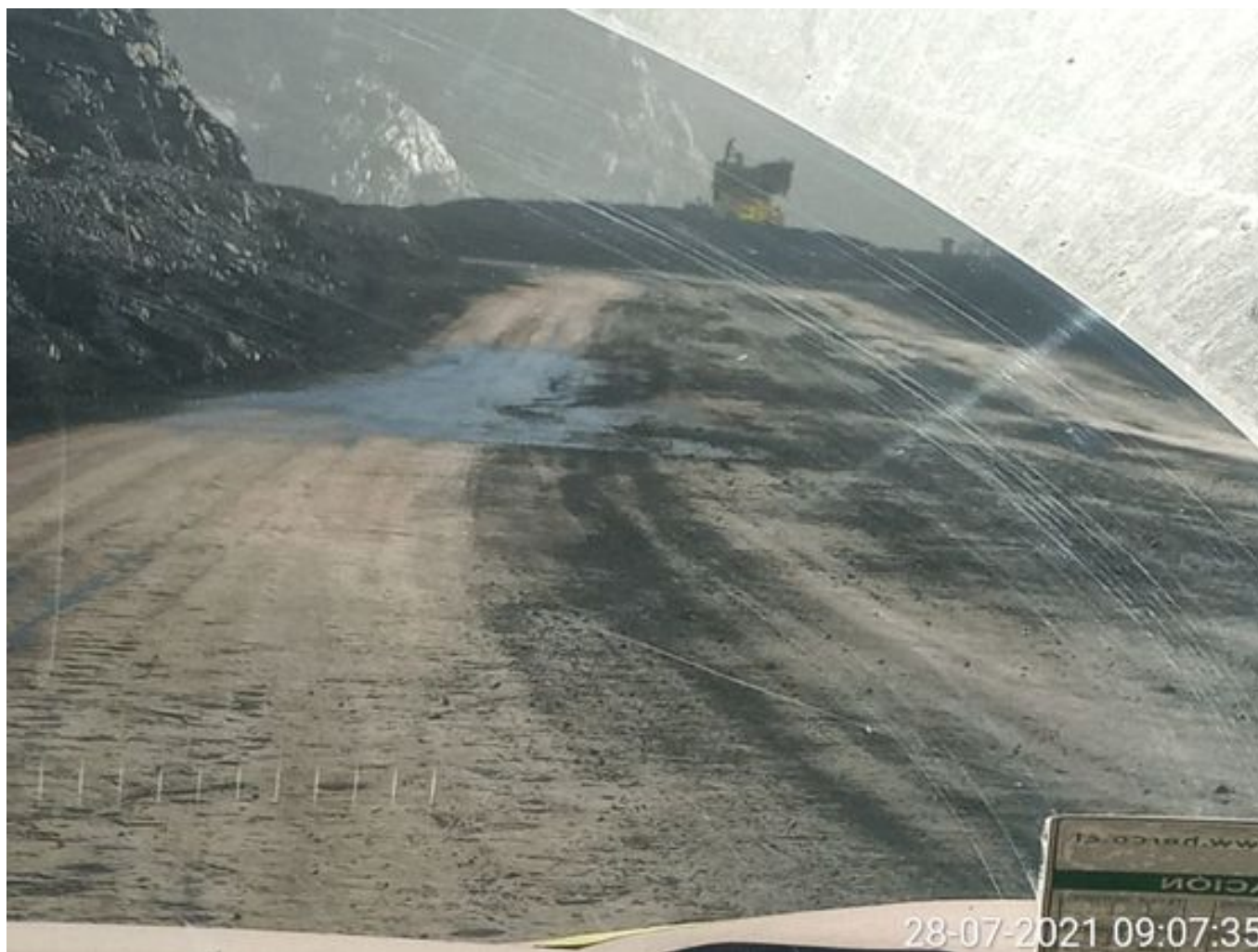
Foto 4: Medida: Riego de caminos. Lugar: Fases Inferiores. Comentarios: rampas con aplicación de producto operativo entre cortado con 3 camiones Das en pistas , el backup se encuentra con fuga de aire en el acumulador de aire, botaderos detenidos por alerta mp10