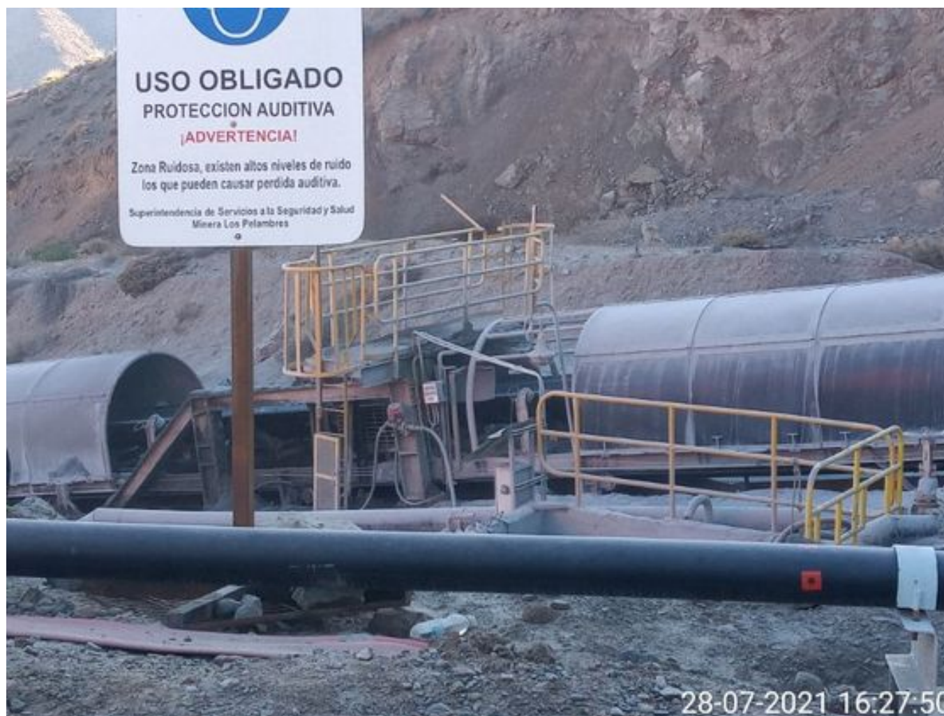
Foto 16: Medida: Regaderas en Correa Transportadora. Lugar: Salida túnel 3. Comentarios: correas detenidas por falta de mineral en proceso en stock pile de chancado