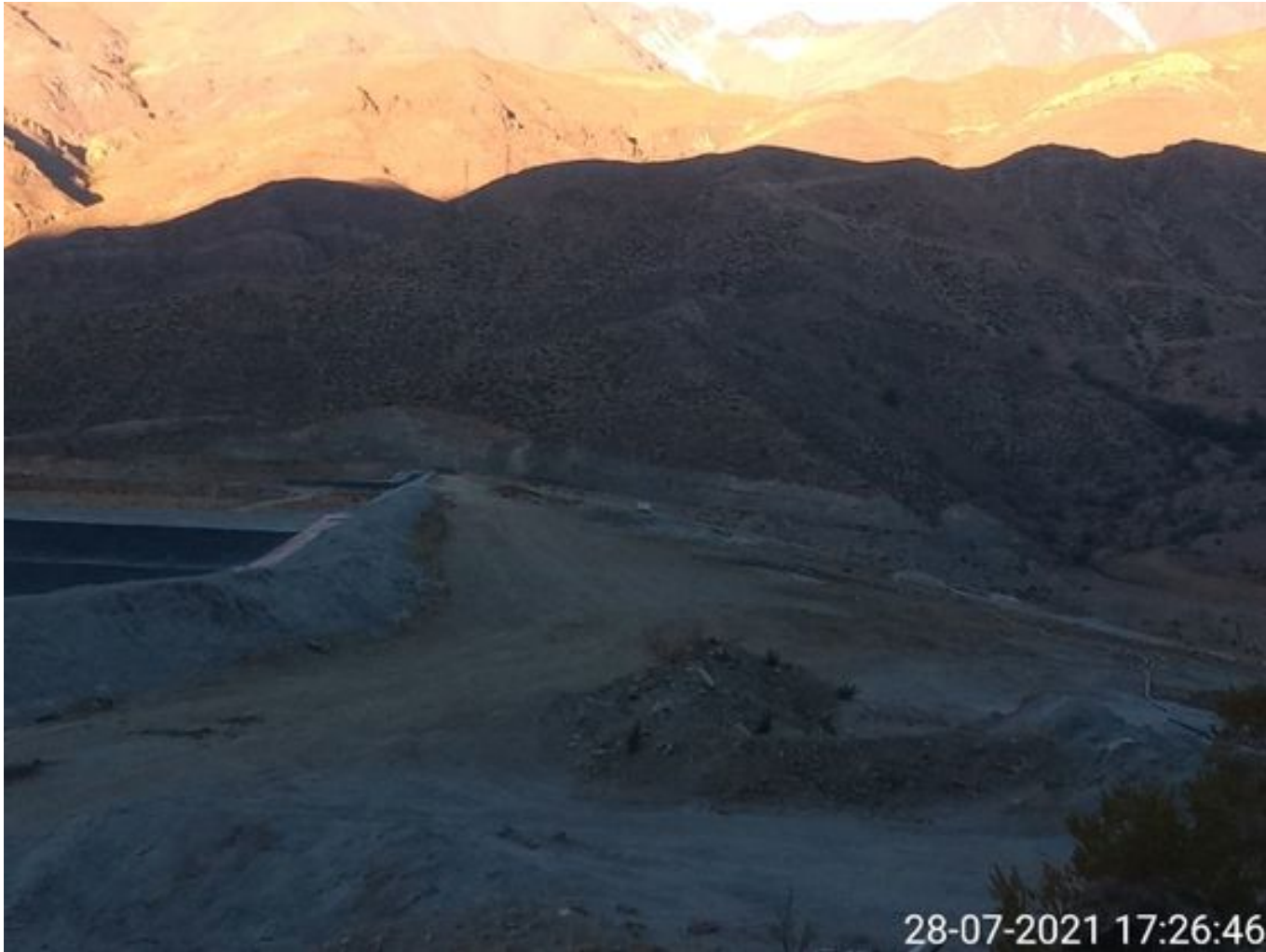
Foto 41: Medida: Aplicación Soiltiac coronamiento del muro. Lugar: Tranque Quillayes. Comentarios: no se observan trabajos en el área