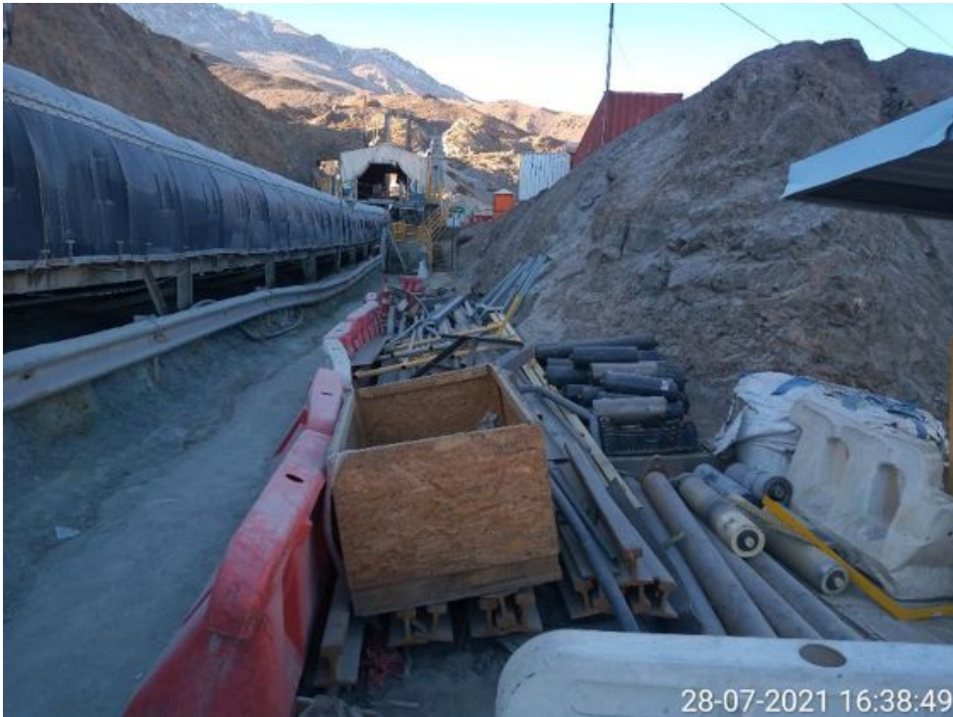
Foto 14: Medida: Limpieza costado Correa CV 007. Lugar: Post-Mantención. Comentarios: costado de correa operativo