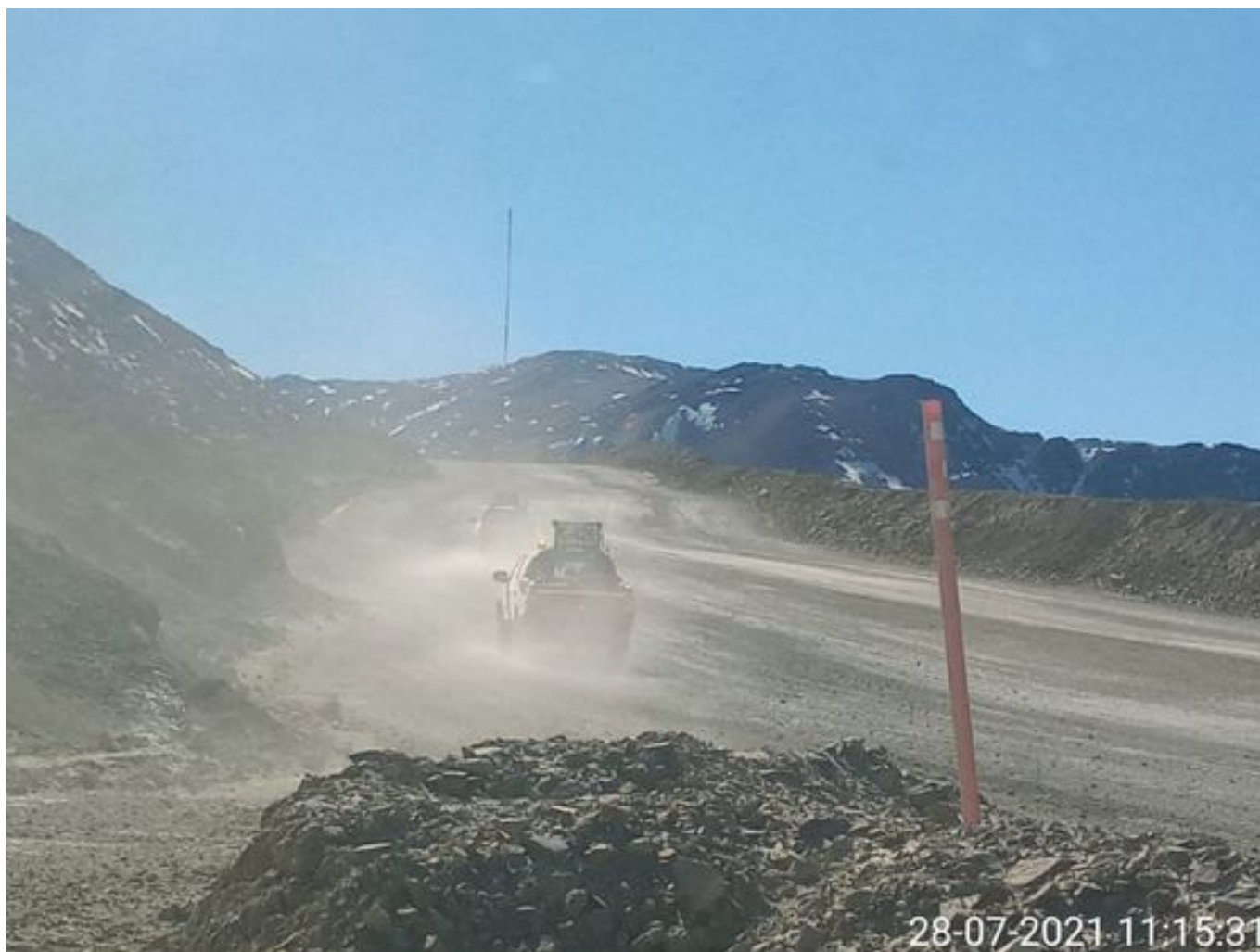
Foto 10: Medida: Riego de caminos EPSA Cerro Amarillo. Lugar: Fases superiores. Comentarios: rampas se encuentran sin humectacion , equipos de carguío se encuentran detenidos por alerta mp10, pero al transitar vehículos livianos se observa material particulado