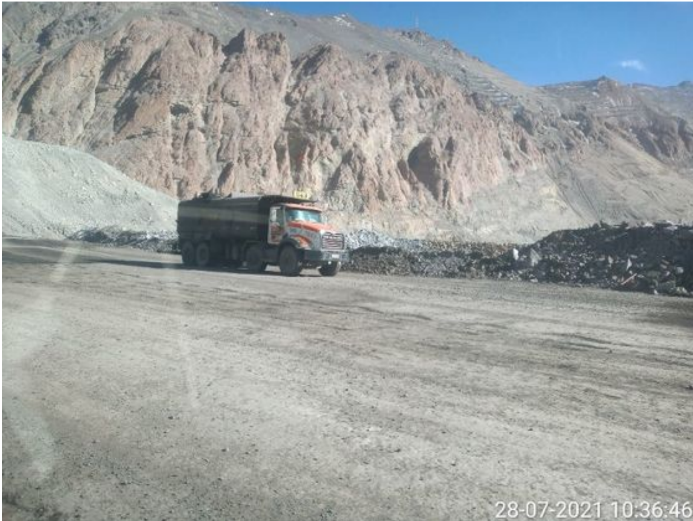
Foto 1: Medida: Riego de caminos. Lugar: Fases Intermedias. Comentarios: rampas con aplicación de producto operativo entre cortado con apoyo de camiones DAS, empresa besalco tanto como camiones aljibes y equipos de apoyo no trabajan en turno noche ni en turno día, fuentes de emisión tránsito de Caex , descarga de caex en taza de chancado y laderas y pretilas por fuertes ráfagas de viento