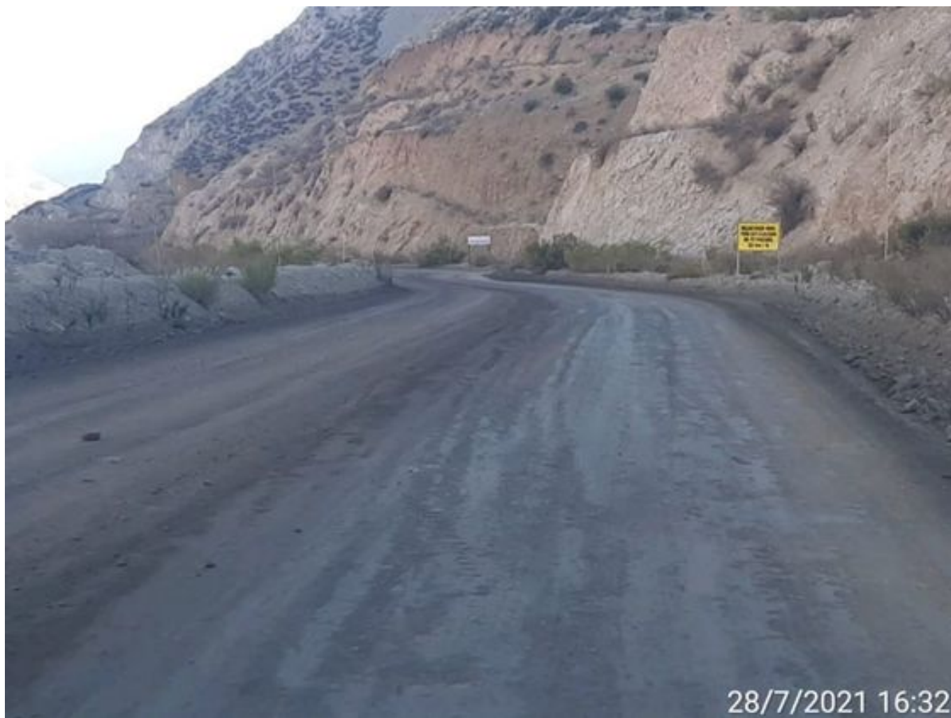
Foto 27: Medida: Aplicación Dust Control camino alternativo. Lugar: Estribo derecho Tranque Quillayes. Comentarios: camino con aplicación de producto operativo