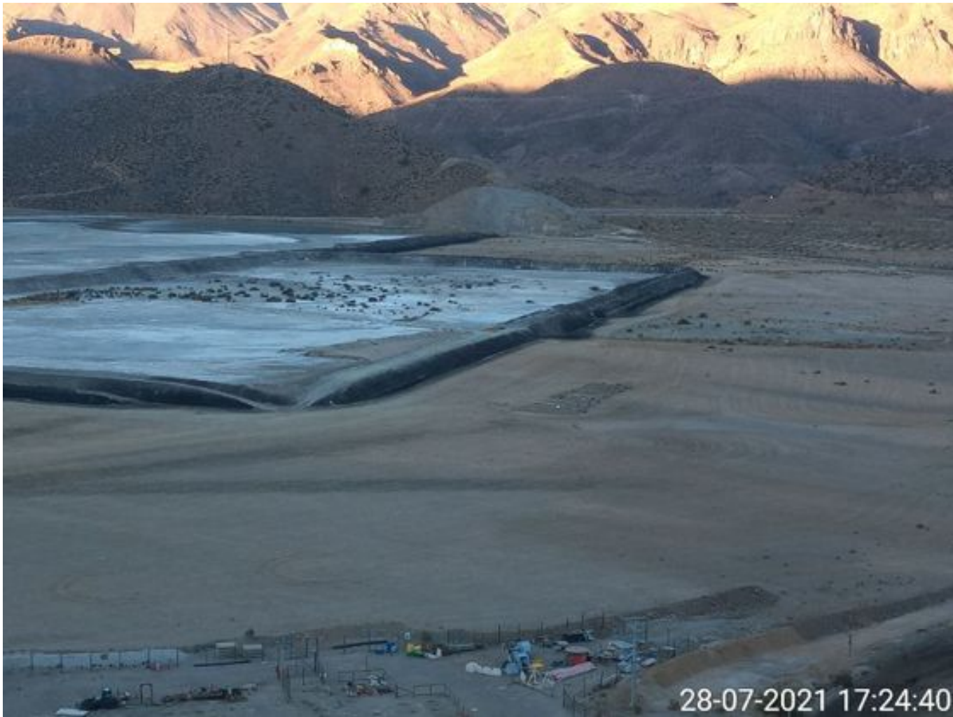
Foto 39: Medida: Aplicación de εμπρεstito. Lugar: Sector Tranque. Comentarios: no se observan trabajos en el área