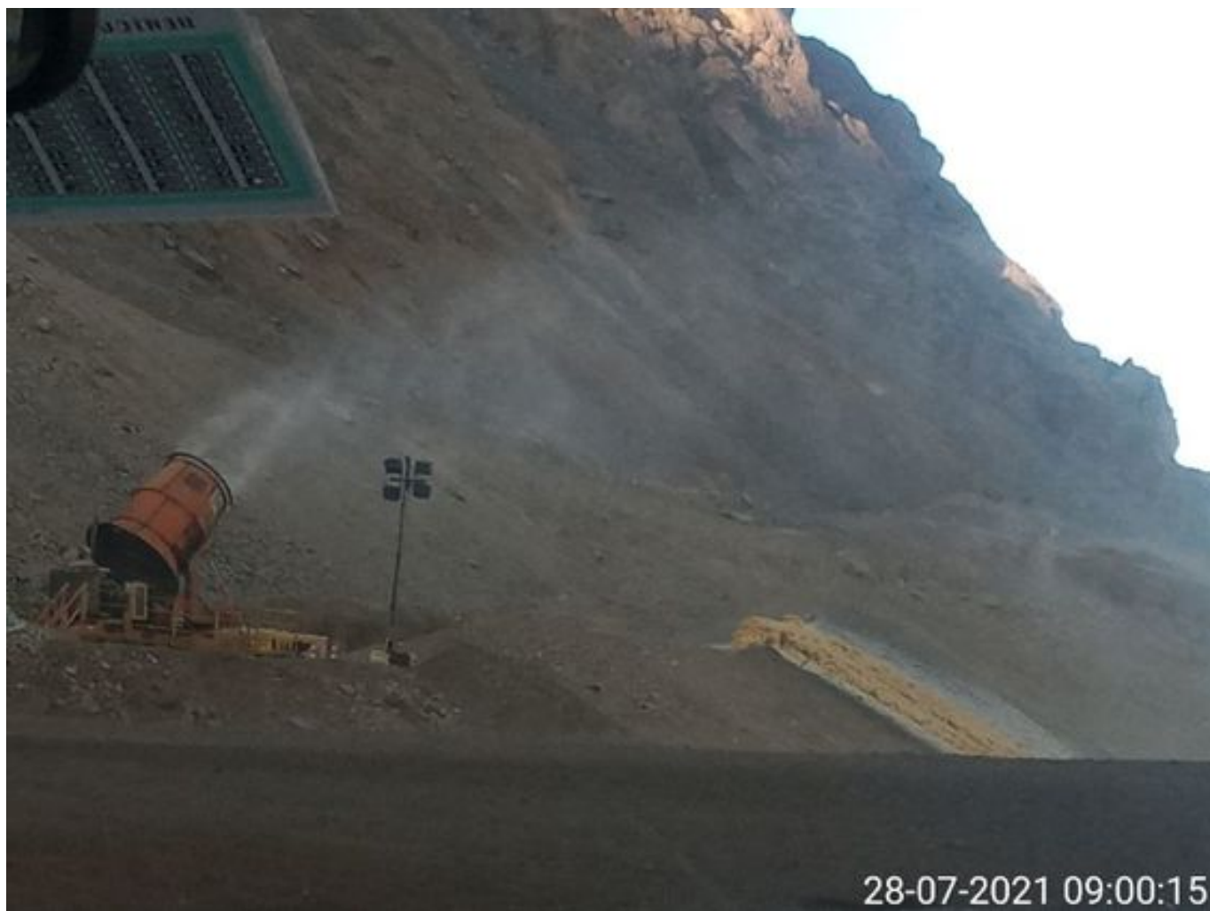
Foto 12: Medida: Fogcannon 2. Lugar: . Comentarios: equipo operativo desde las 02:15 hrs de anoche